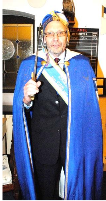
Ritterhelm, Schärpe (zu tragen von rechts oben nach links unten) Rittermantel (zu besonderen Anlässen*), Schwert