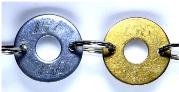
bis a.U. 165