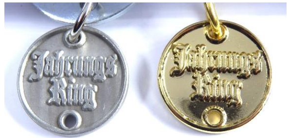
ab a.U. 165