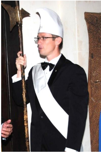
Sturmhaube und Bandelier (weiß), Westentasche, Partisane