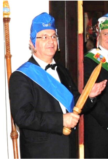
Junkerhelm und Bandelier (blau), Westentasche, Dolch